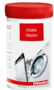
Miele GP DC WG 0252 P Entkalker 250g für Waschmaschinen & Geschirrspüler