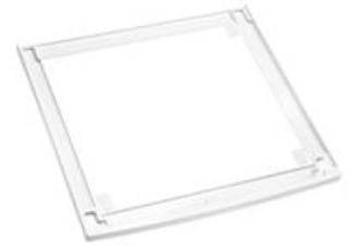
Miele WTV502 Wasch-Trocken-Verbindungssatz für W1 Chrome/White Edition + T1 White Edition